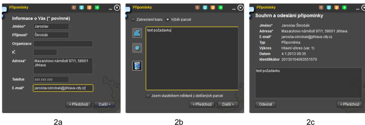
Obr. 2. Průvodce zadáváním požadavku připomínkování

Kontaktní údaje a zejména e-mail bylo nutné vyplnit pro další případný kontakt s žadatelem. Po odeslání požadavku dochází v pozadí ke spuštění několika dalších procesů: