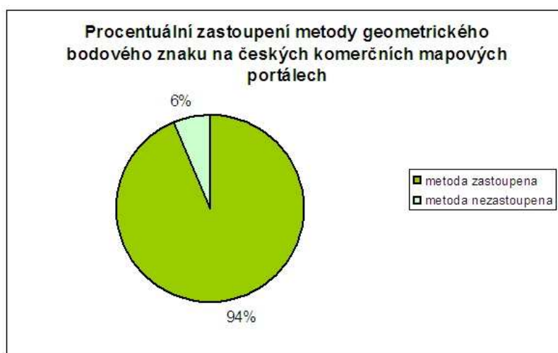
Obr. 2: náhled grafického statistického zhodnocení zkoumaných metod

Co se týče mapových metod většina výsledků byla předvídatelná (jako např. cca 97% zastoupení bodových geometrických znaků) některé však byly velmi překvapující (jen cca 3% zastoupení katogramu a ještě menší zastoupení kartodiagramu). Jako problém se často ukázalo nedodržování kartografických zásad a pravidel. Např. hned první zásada jednoty bývá velice často nedodržena, neboť celosvětovým trendem je, že na úkor odborné a technické stránky je výrazně dáván zřetel na estetickou stránku, za účelem přilákání potenciálních zákazníků a kvalita obsahu a zpracování je tak odsunuta až na druhou kolej. V současné době je problémem především otázka legendy, která je v současné době snad největším problémem a výskyt opravdu kartograficky korektní legendy je na mapových portálech velmi vzácný.